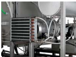
Condensate drain cooler and vacuum pump / Raffreddamento della condensa sullo scarico e della pompa del vuoto