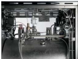
Modulating valve on steam inlet Valvola modulante nell'ingresso vapore