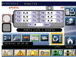
DCS PLUS 10 process controller Controllore di processo DCS PLUS 10